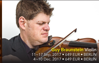
Guy Braunstein Violin

11–17 Sep. 2017 • from 749 EUR • VIENNA 30 Oct.–5 Nov. 2017 • from 749 EUR • BERLIN