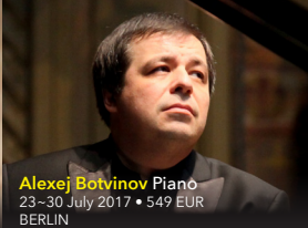
Alexej Botvinov Piano