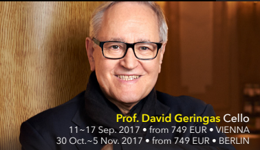
Prof. David Geringas Cello

11–17 Sep. 2017 • from 749 EUR • VIENNA 30 Oct.–5 Nov. 2017 • from 749 EUR • BERLIN