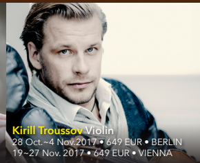
Kirill Trousov Violin

28 Oct.–4 Nov. 2017 • 649 EUR • BERLIN 19–27 Nov. 2017 • 649 EUR • VIENNA