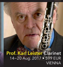
Prof. Karl Leister Clarinet