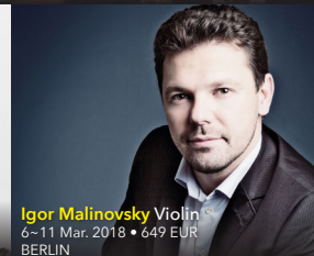
Igor Malinovsky Violin