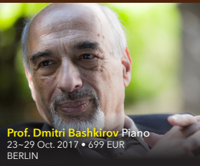
Prof. Dmitri Bashkirov Piano

11–16 Oct. 2017 • 549 EUR • BERLIN 1–6 Nov. 2017 • 549 EUR • VIENNA